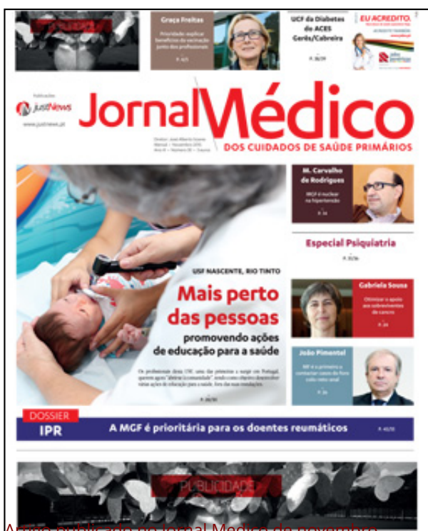
Artigo publicado no jornal Médico de novembro.

Queremos que o “Pulsar da ciência ao ritmo do coração” seja sentido e vivido por todos! Para isso, contamos com a vossa participação! O CPC2016 já começou!