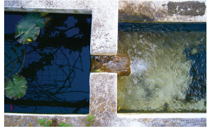
Autor: Ana Pereira