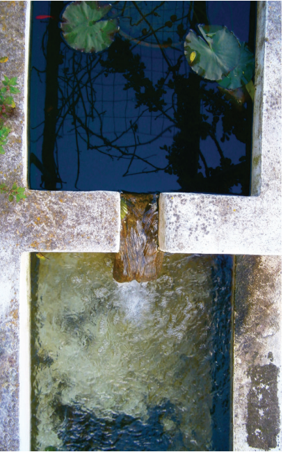
Autor: Ana Pereira