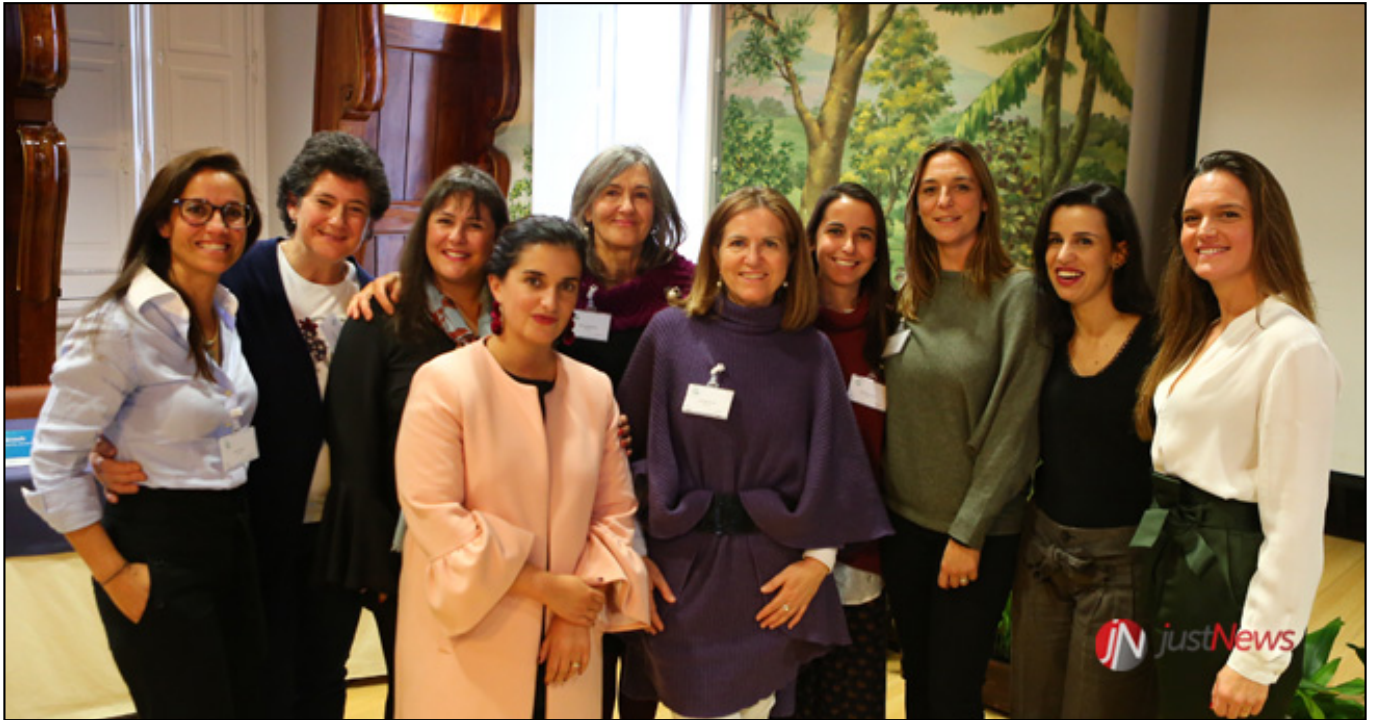
Elementos da equipa de cuidados paliativos, durante a sua apresentação, em 2017

O evento, subordinado ao lema "Proximidade e Inovação", decorrerá no auditório Acácio Barreiros do Centro Cultural Olga de Cadaval e nas Salas de Fotografia e Emílio Paula Campos do MU.SA e inclui ainda a realização de uma dezena de workshops .