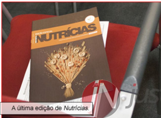
A última edição de Nutricias.