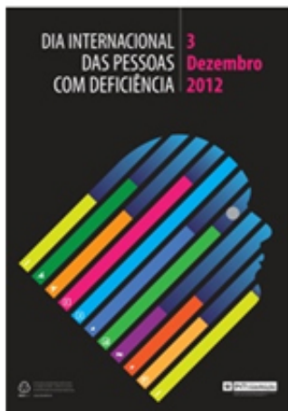
Cartaz vencedor em 2012