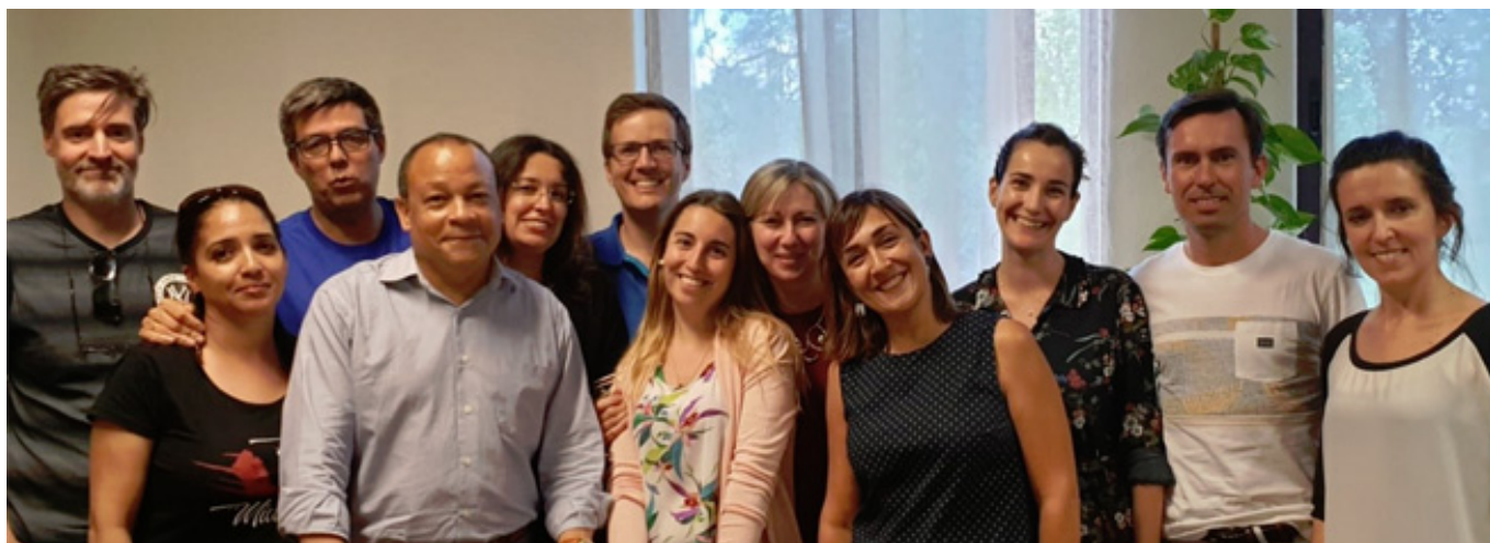
Elementos fundadores e membros dos Órgãos Sociais da IntNSA Portugal

Criada em maio de 2019, a IntNSA Portugal integra na sua Direção um conjunto de profissionais com experiência em Saúde Comunitária e Saúde Mental e Psiquiátrica, maioritariamente de unidades da Península de Setúbal.