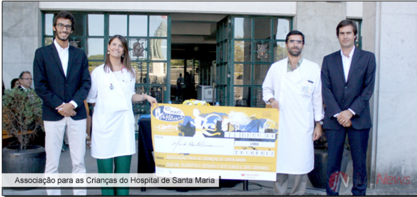
Associação para as Crianças do Hospital de Santa Maria