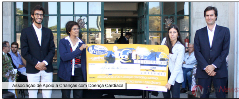
Associação de Apoio a Crianças com Doença Cardíaca