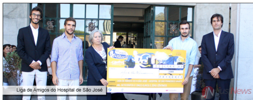
Liga de Amigos do Hospital de São José