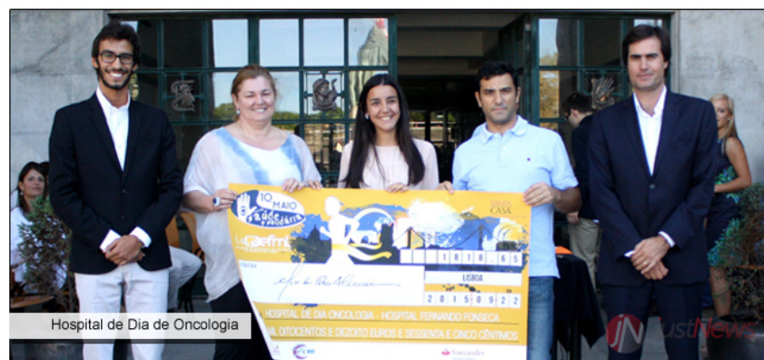
Hospital de Dia de Oncologia