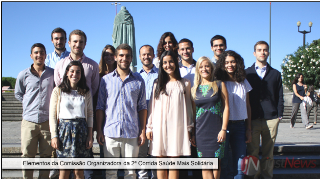
Elementos da Comissão Organizadora da 2ª Corrida Saúde Mais Solidária