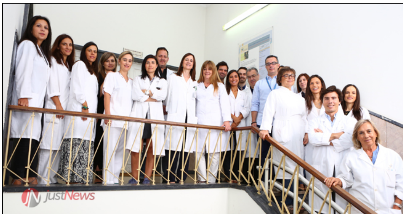
Equipa do Serviço de Dermatologia do CHP

Em declarações à Just News, a diretora do Serviço de Dermatologia do CHP explica que a 30.ª edição do Fórum Dermatologia inclui, "como nos anos anteriores, um simpósio de Dermatologia Pediátrica, uma sessão interativa com casos clínicos e a apresentação de trabalhos científicos sob a forma de poster".